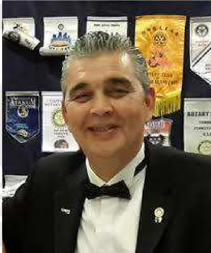
N. Altan Arslan Kızılay Rotary Kulübü