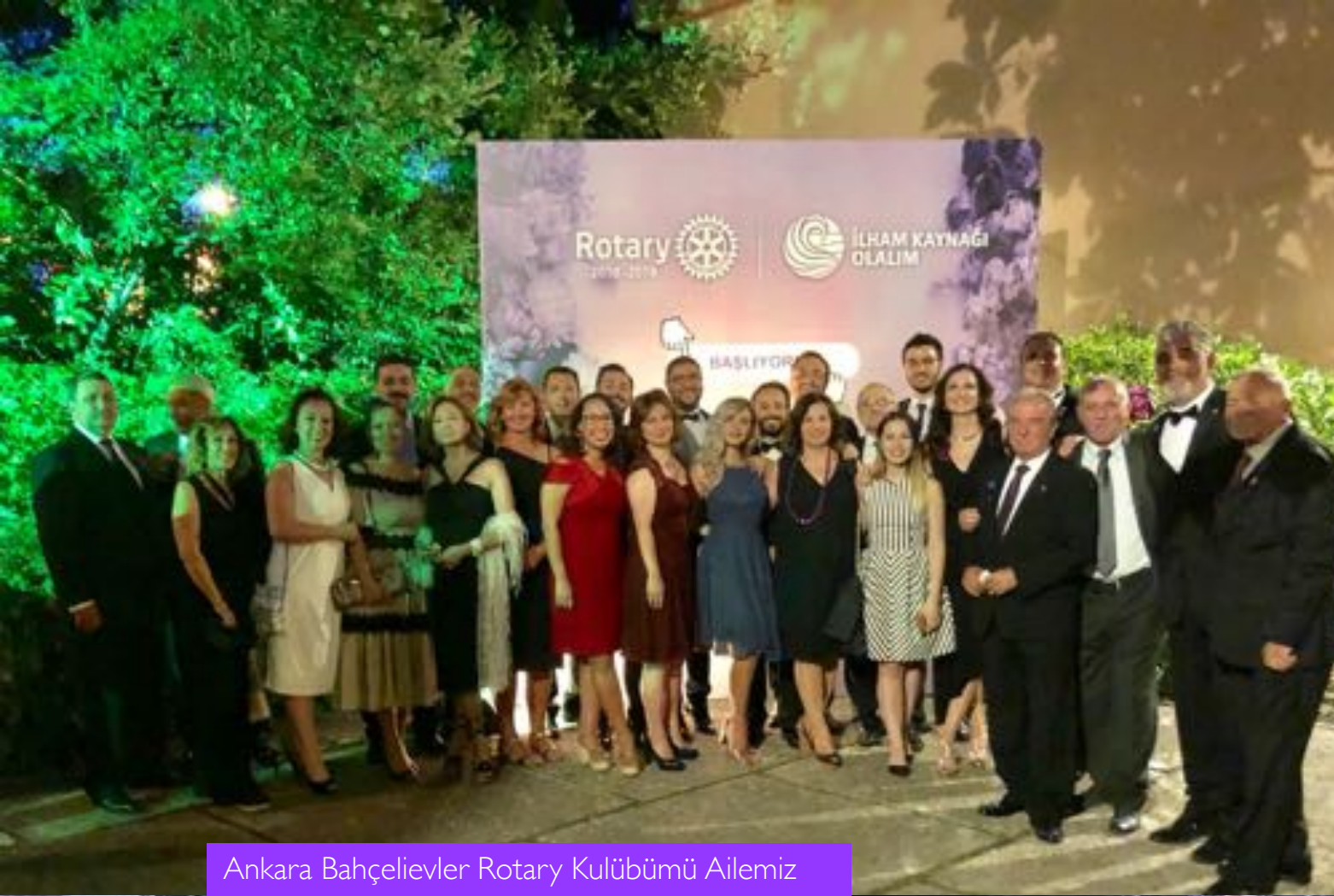
Ankara Bahçelievler Rotary Kulübümü Ailemiz