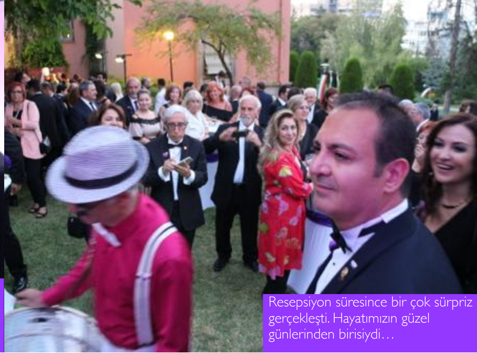
Reepsiyon süresince bir çok sürpriz gerçekleşti. Hayatımızın güzel günlerinden birisiydi...