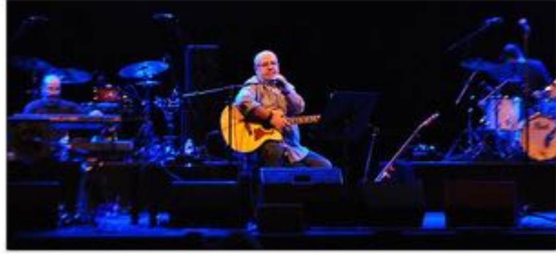
Bülent Ortaçgil çok güzel bir konser verdi. Bizlere güzel bir müzik ziyafeti yaşattı...