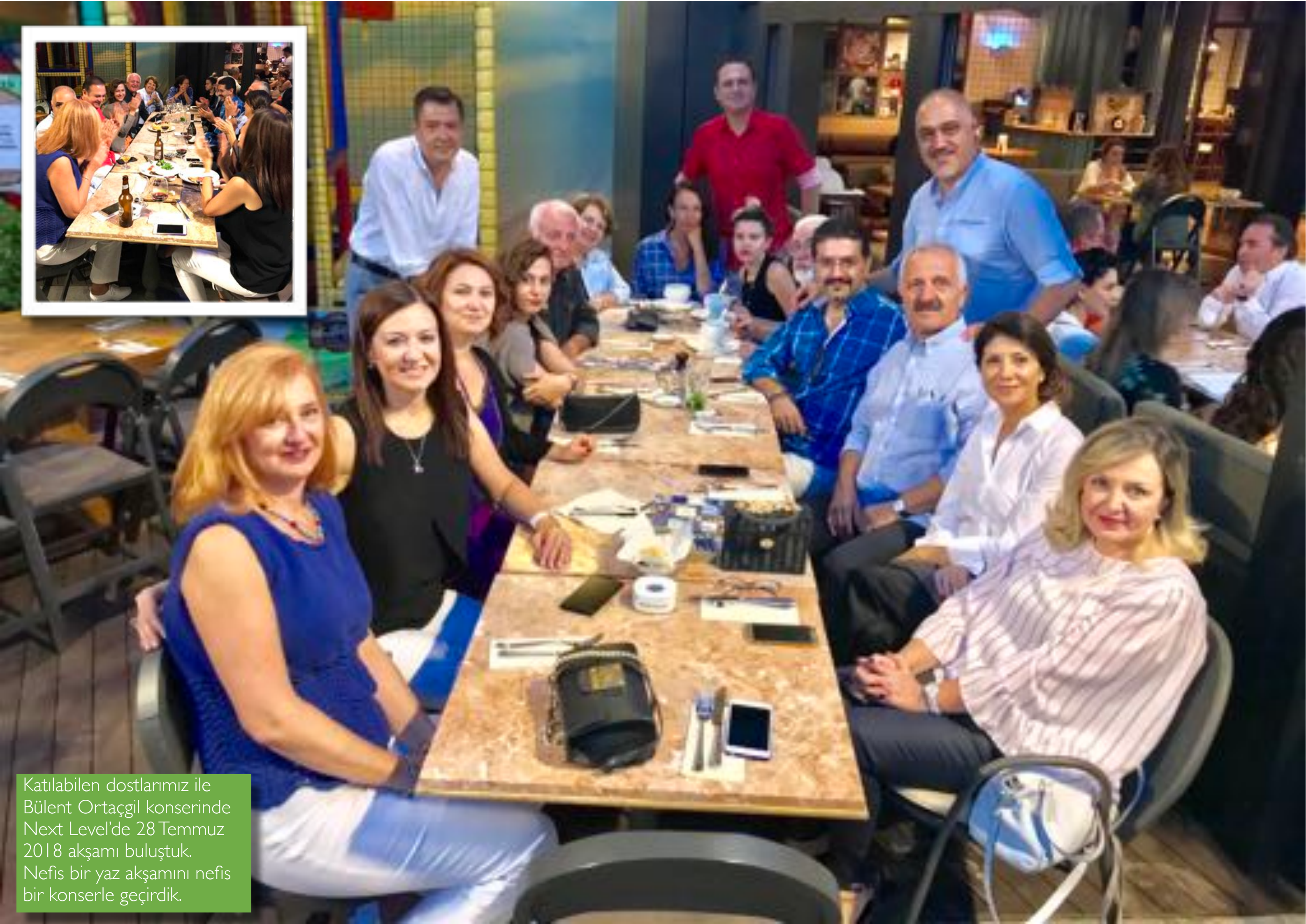
Katılabilen dostlarımız ile Bülent Ortaçgil konserinde Next Level'de 28 Temmuz 2018 akşamı buluştuk. Nefis bir yaz akşamını nefis bir konserle geçirdik.