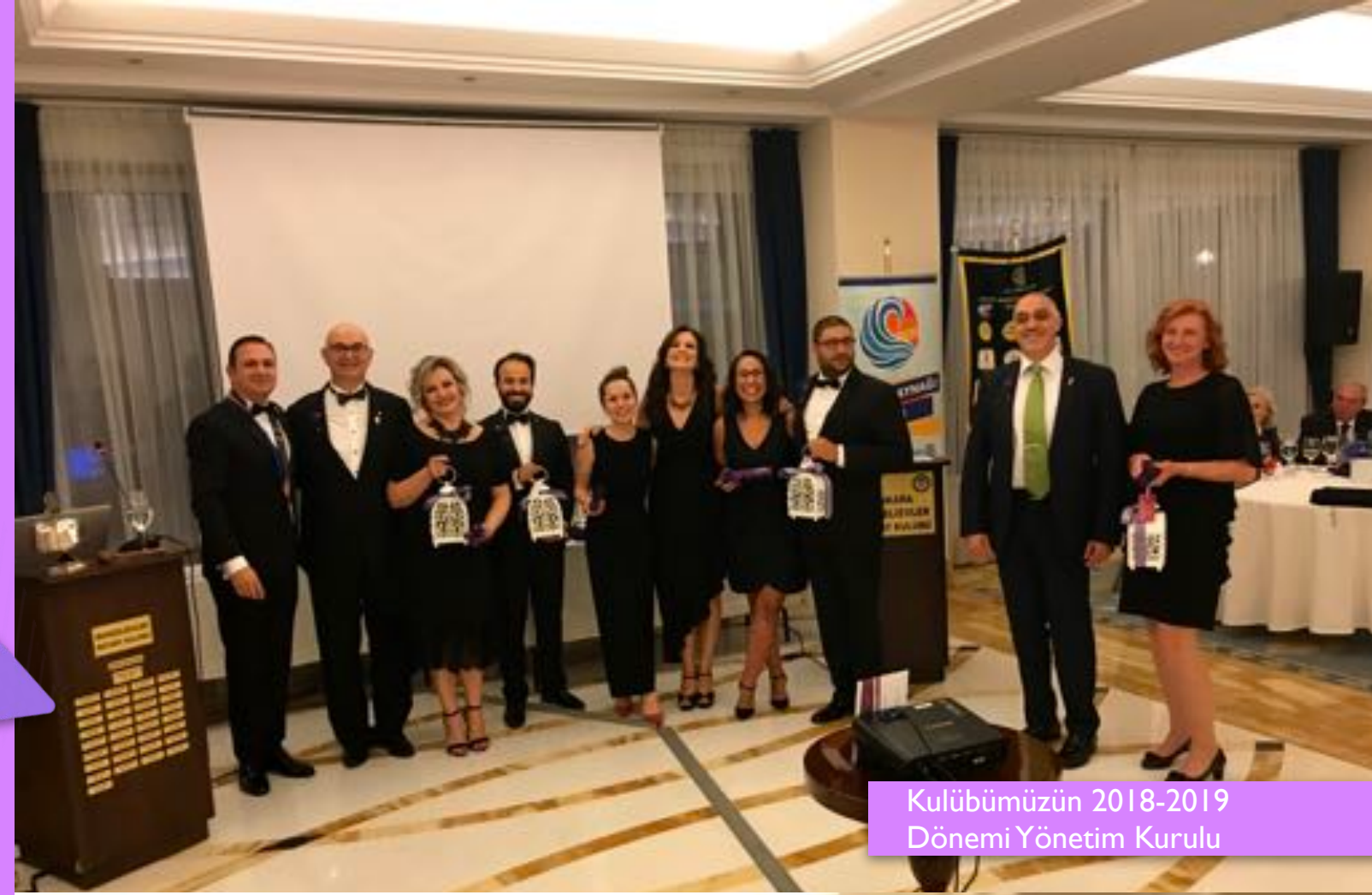
Kulübümüzün 2018-2019 Dönemi Yönetim Kurulu