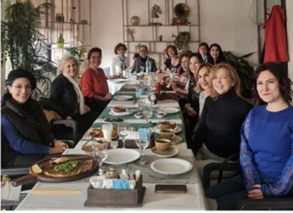
3 Aralık 2022 Cumartesi Eřler Toplantısı